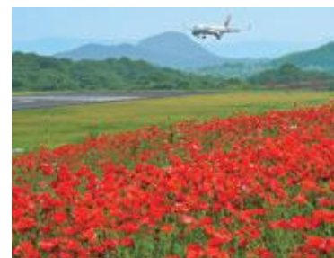
飛行機とポピー 撮影場所:さぬきこどもの国 (高松空港まつり2016 フォトコンテスト 入賞作品)