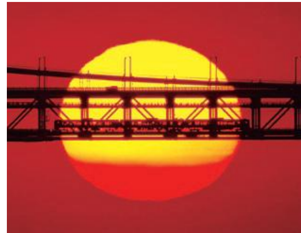
マリンライナーと夕陽 撮影場所:与島PA

香川のローカル線・ことでんは、全国から集まった古い車両をメンテナンスして使用してきた歴史があり、製造年代や型の違うさまざまな車両に出会えると、鉄道ファンに人気です。 特に、国内最古級の車両を含んだ「レトロ列車」と呼ばれる4両がイベント運行などで活躍しています。2021年までには引退することが決定しているので、撮影するなら今のうち。セピアカラーやモノクロでレトロ感を演出するのもおすすめです。 また、本州と四国を結ぶ瀬戸大橋を走るJR瀬戸大橋線・マリンライナーと、瀬戸内海に沈みゆく夕陽を、タイミングをあわせて撮影すれば幻想的な一枚に! 県内に点在するおむすび型の山を背景に列車が走る風景も香川県ならではのです。