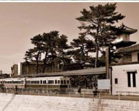
(上)ことでん「レトロ列車」と玉藻城 撮影場所:ことでん高松築港駅周辺 (下左)ことでん「レトロ列車」と駅舎 撮影場所:ことでん琴電琴平駅 ※セピアカラー (下右)ことでん「レトロ列車」と羽床富士 撮影場所:ことでん琴平線栗熊駅-羽床駅間