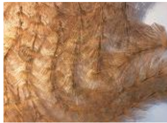
西堀隆史 北浜の小さな香川ギャラリー 「うちわの骨の広場」(参考画像)(高松港周辺)

【問合せ先】〒760-0019 香川県高松市サンポート1-1 高松港旅客ターミナルビル3F 瀬戸内国際芸術祭総合案内所 TEL:087-813-2244