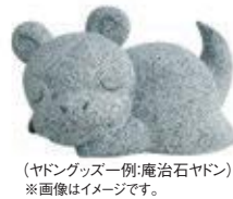
(ヤドングッズ一例:庵治石ヤドン) ※画像はイメージです。

《第1期》2019年4月19日～ 2019年9月30日(当日消印有効) 《第2期》2019年10月1日～ 2020年1月31日(当日消印有効)