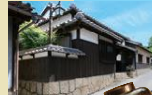
築215年の建物などを利用した、古民家宿「やかた船」。 瀬戸内の恵みを使った魚料理が自慢。 予約をすれば、あなご丼や鯛の焼き物などの昼食や、飲み物もいただける。 やかた船 (問合せ先)TEL:080-3886-9819(要予約)

信長・秀吉・家康らの朱印状や咸臨丸の模型など、多くの資料を所蔵・展示する「塩飽勤番所」。塩飽水軍の歴史を知ることができる。