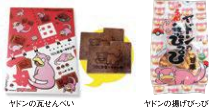
ヤドンの瓦せんべい