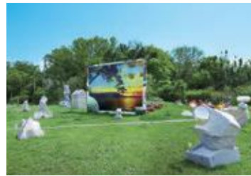
金氏徹平 「S.F(Smoke and Fog)」 (屋島)

公式ウェブサイト ( https://setouchi-artfest.jp )