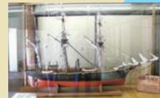
塩飽勤番所 (開館時間)9:00~16:00 (定休日)月 (問合せ先)TEL:0877-27-3540