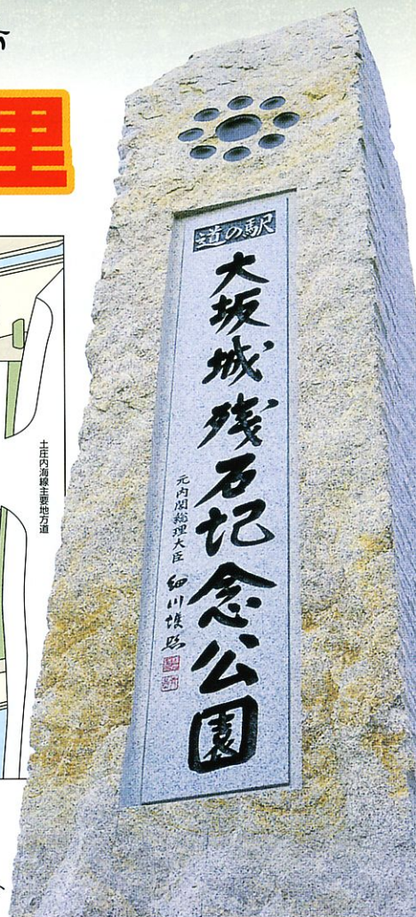
石のモニュメント