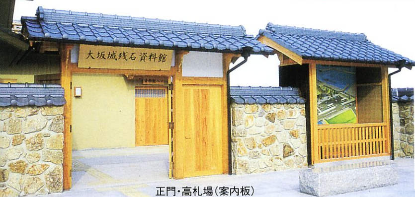
正門・高札場(案内板)