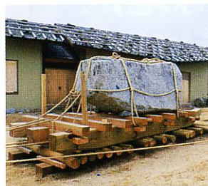
残石を運んだ修羅(復元)