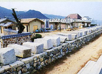
大坂城築城残石群