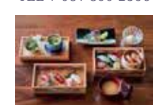
寿司御膳 4,950 円