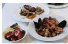
季節のコース 3,000 円