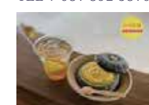
かぼちゃアイス 800 円 直島限定せとぼん 650 円