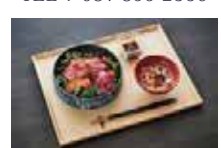
牛 GYU ローストビーフ丼 2,800 円

営 12:00 ~ 15:00 (L.O. 14:00) 21:00 ~ 25:00 (L.O. 24:00)