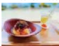
せとぼん 650 円とオリーブ牛のステーキビラ 1,080 円

営 3 ~ 9 月 10:30 ~ 17:45 (L.O. 17:30) 10 ~ 2 月 10:30 ~ 16:45 (L.O. 16:30)