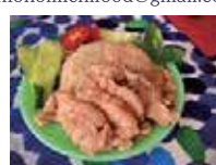
カオマンガイ 750 円