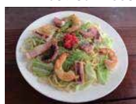
直島塩やきそば 900 円

営 11:00 ~ 13:30 17:00 ~ 21:00 (L.O. 20:30)