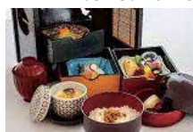
旬菜弁当 3,259 円