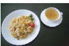
チャーハン 600 円