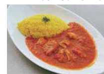
オリーブ豚のトマト煮込み 1,250 円