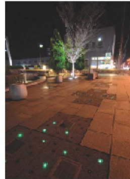
片原町ポケットパーク

昼間多くの人が訪れる市庁舎は、隣接している片原町ポケットパークと調和をはかり、夜は一転してほのかな灯りが優しく存在感をアピールしています。