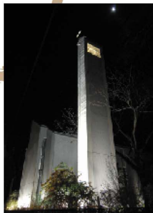
四国学院大学チャペル

シャープな建物をさらにライトアップで強調し、窓にはカラフルな光を配して、楽しい印象を演出しています。