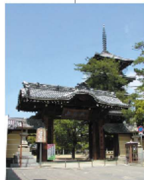
総本山善通寺五重塔