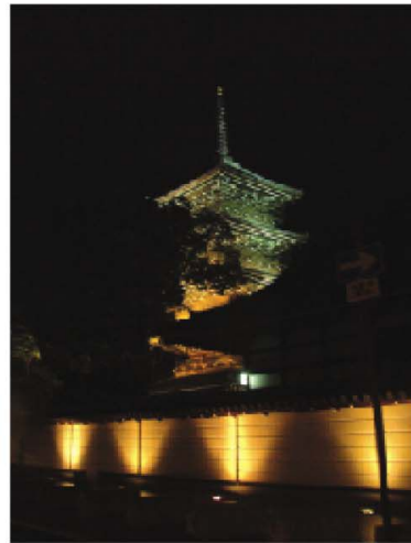
総本山善通寺 五重塔

まちのシンボルである五重塔は、暖色から寒色へと光を変化しています。光を変化させることにより、天に向かって光り輝く演出をしています。