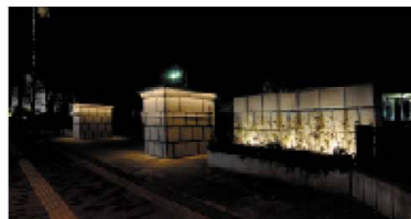
四国学院大学正門

まちのシンボルである五重塔は、暖色から寒色へと光を変化しています。光を変化させることにより、天に向かって光り輝く演出をしています。