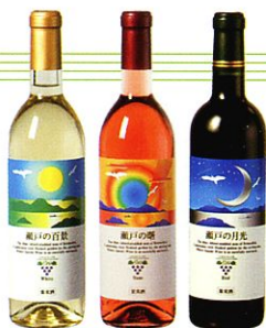
さぬきワイン 市内のワイナリーで作られた 県内産のブドウを使ったワイン

1Fの特産品コーナーではさぬき市の特産物のほかに、香川県の各地の特産物も豊富に取り揃えています。ワイナリーで作られたワインやジュースの無料試飲コーナーもあります。2Fのカフェは、瀬戸内海が一望できるロケーションでゆったりとした時間を楽しめます。2Fのメニューの中には1Fで購入出来る商品もあります。