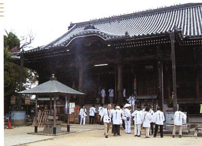
■ 四国霊場88番札所・結願の寺

アクセス: JR高德線造田駅から、車で5分 琴電長尾駅から、徒歩5分 高松自動車道志度ICから15分