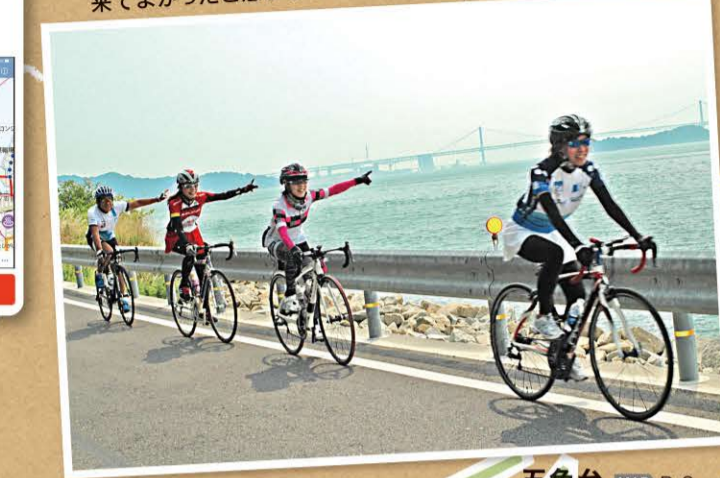
五色台 MAP D-2