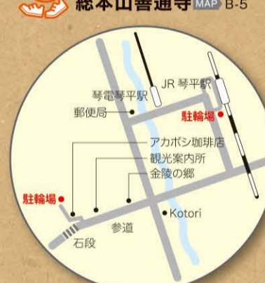
総本山善通寺 MAP B-5