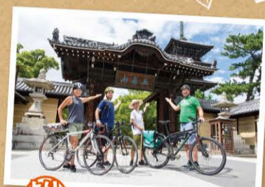
真言宗善通寺派の 総本山