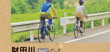
財田川 MAP C-7