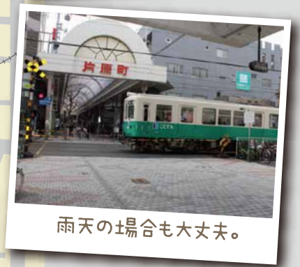
雨天の場合も大丈夫。