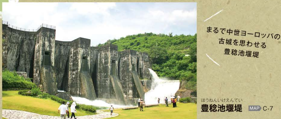
まるで中世ヨーロッパの古城を思わせる豊稔池堰堤