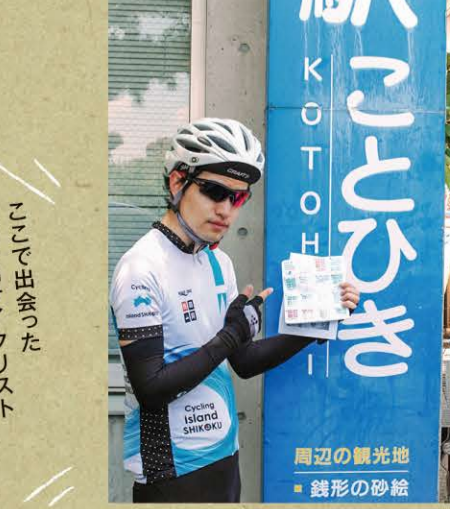
道の駅 ことひき MAP-B-5