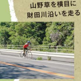
山野草を横目に財田川沿いを走る