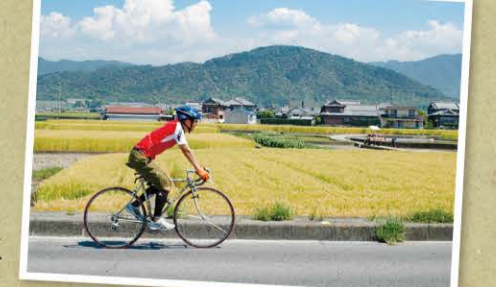
5月から6月にかけて麦畑が金色に輝きます