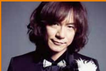
ダイヤモンド☆ユカイ