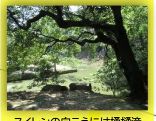
スイレンの向こうには桶樋滝