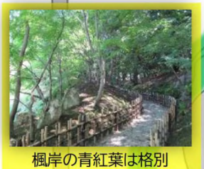
楓岸の青紅葉は格別