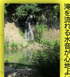
滝を流れる水音が心地よい 桶樋滝