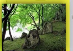
手入れされた苔も 青々として美しい