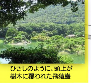
ひさしのように、頭上 が樹木に覆われた飛猿巖