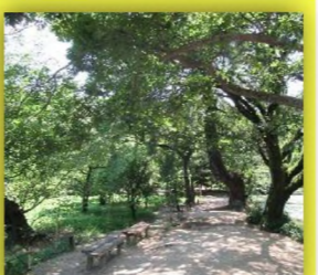
西湖の木陰にはベンチを設置 時折、岸辺に風が渡る