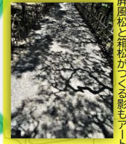
屏風松と箱松が つくる影セアート