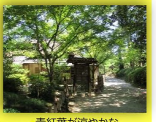
青紅葉が涼やかな 日暮亭前の園路