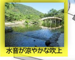
水音が涼やかな吹上