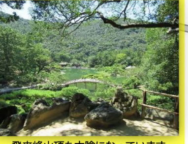
飛来峰山頂も木陰になっています