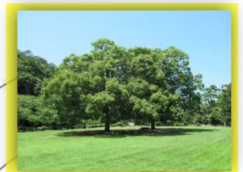
北芝生広場ではクスノキの大木 2本が木陰をつくっています