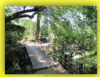
モミジのトンネル