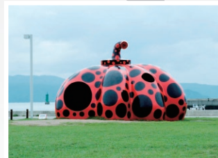
草間彌生「赤かぼちゃ」2006年 直島・宮浦港緑地