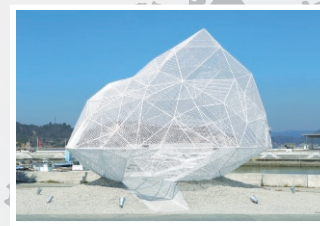
直島パヴィリオン 所有者:直島町 設計:藤本壮介建築設計事務所

27の島々で構成される直島町の「28番目の島」というコンセプトで、軽快で浮遊感のある形が特徴。