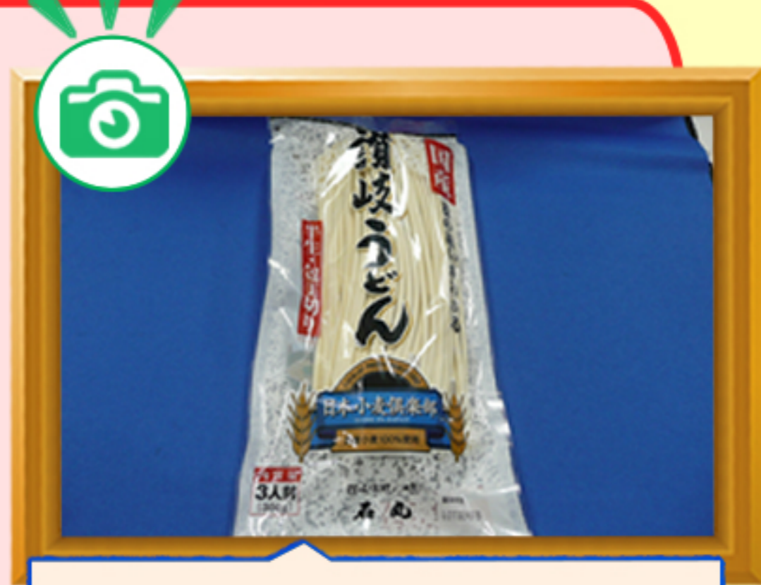
日本小麦倶楽部半生讃岐うどん包丁切り

香川県民の第2の主食ともいべき存在。生産量は、ゆでうどん・生うどん・乾燥うどんのいずれをとっても日本一。つややかな麺のコシとつるりとした舌触り、のどごしの良さが魅力です。