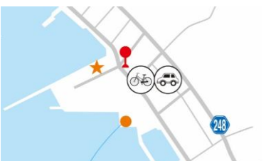
【MAP표시】 ★페리 매표소 ●페리 승선장 ☆고속정 매표소 ●고속정 승선장