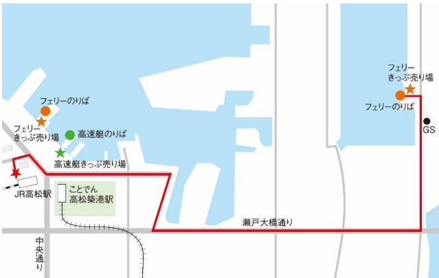
무료 셔틀버스 시각표

다카마츠히가시 항까지는 다카마츠 역 버스 터미널 8번 ★에서 무료 셔틀 버스가 운행 중입니다. 소요 시간은 약 5분이지만 거리는 4km정도 되므로 도보 이동의 경우 주의하시기 바랍니다.