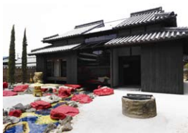
豐島橫尾館 Teshima Yokoo House