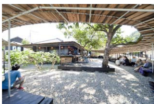
安部良「島嶼廚房」 Ryo Abe "Shima Kitchen"