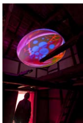
Pipilotti Rist「你最初的顏色」(我腦中的答案是我的胃酸) Pipilotti Rist "Your First Colour (Solution In My Head ? Solution In My Stomach)"