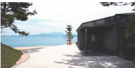
คริสเตียน โบลแทนสกี “โรงเก็บเสียงหัวใจ” Christian Boltanski “Les Archives du Coeur”

607 Karato, Teshima, Tonosho โทร. +81-879-68-3555 10.00 - 17.00 น. (ต.ค. - ก.พ. เปิดถึง 16.00 น. ควรไปก่อนเวลาปิดอย่างน้อย 30 นาที) หยุดทุกวันอังคาร (ธ.ค. - ก.พ. หยุดตั้งแต่วันอังคาร ถึงพฤหัสบดี) ค่าเช่า : 1,540 เยน