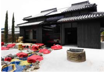
เทชิมะ โยโกเฮาส์