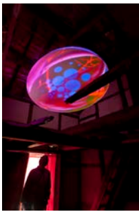
ปิปีโลทติ ริส "สีแรกของคุณ"

Pipilotti Rist "Your First Colour (Solution In My Head ? Solution In My Stomach)"