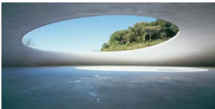
เทชิมะ อาร์ต มิวเซียม Teshima Art Museum

เกาะที่อยู่ตรงกลางระหว่างจังหวัดคางาวะและโอคายามะ จากท่าเรือทากามาทสึ เดินทางโดยเรือเฟอร์รี่ใช้เวลาประมาณ 35 นาที เกาะเทชิมะดินแดนที่อุดมไปด้วยธรรมชาติที่สมบูรณ์ หาดทรายสีขาวตัดกับน้ำทะเลสีฟ้าคราม พุงนาเขียวชอุ่มกว่า 50 ไร่เรียงรายเป็นขั้นบันไดลดหลั่นกันไป พืชผลทางการเกษตรมีมากมายหลากหลายชนิด อาหารทะเลสดใหม่ ผักเก็บสด ๆ จากสวน ข้าว ส้ม มะกอก มะนาว และสตอร์วเบอร์รี่ มีของให้ได้รับประทานตลอดทั้งปี ภายหลังเกาะนี้ได้ผันตัวเองมาเป็นดินแดนแห่งศิลปะ พิพิธภัณฑ์ศิลปะที่สร้างขึ้นมาผสมผสานกับธรรมชาติที่มีมาแต่ดั้งเดิมได้อย่างลงตัว การเดินทางภายในเกาะนั้นมีหลายวิธี แต่เนื่องจากบนเกาะมีเนินมาก แนะนำให้เช่าจักรยานไฟฟ้า 4 ชั่วโมงในราคาเพียง 1,000 เยน หรือจะโดยสารรถชัทเทิลบัสที่บริการบนเกาะก็ได้