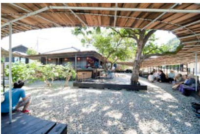
เรียว อาเบะ "ชิมา คิทเชน"