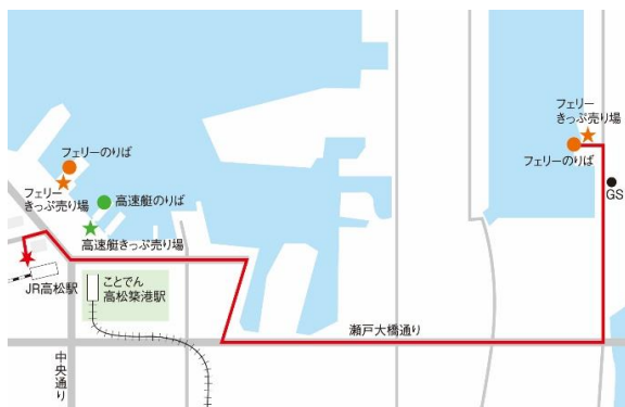
免費接駁巴士時刻表

往高松東港方向的旅客，可以在高松轉運站8號★搭乘免費接駁巴士，搭乘時間約5分鐘。請注意，若是徒步的話則需走約4公里的路程。